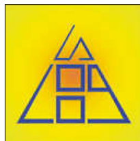
Grafik: H. Buckenhüskes

Zum Zweiten: Sebastian ist seit nunmehr 10 Jahren unser