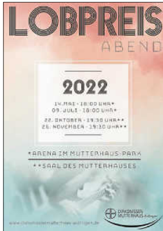
Plakat: DMH Aidlingen

Herzliche Einladung zum Lobpreisabend am 14. Mai auf dem Gelände des Diakonissenmutterhauses Aidlingen. Der Lobpreisabend bietet Raum und Gelegenheit, in Liedern und Gebeten auf Jesus zu schauen und ihn anzubeten und ihn für unsere ganz persönlichen Anliegen um Unterstützung zu bitten. Die Predigt soll uns ermutigen und herausfordern, unser Leben im Einklang mit der Bibel zu gestalten. Denn Gott will zu jedem von uns persönlich reden, damit wir Kraft, Zuversicht und Wegweisung für den Alltag empfangen.