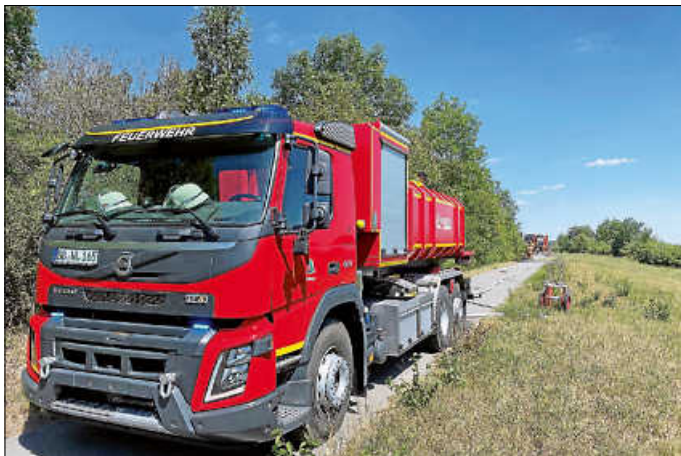
Wechseladerfahrzeug bei der Wasserversorgung

10.08.2022 - 13:57 Uhr: Vegetationsbrand Am vergangenen Mittwoch, den 10.08.2022 um 13:57 Uhr alarmierte die Leitstelle Böblingen die Aidlinger Feuerwehr auf einen Feldweg zwischen Aidlingen und Deufringen.