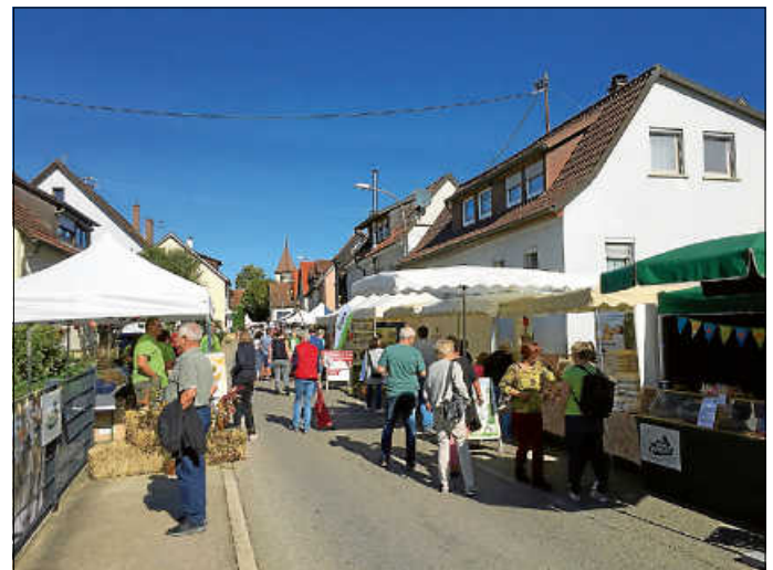
Heckengäutag 2018 in Deufringen