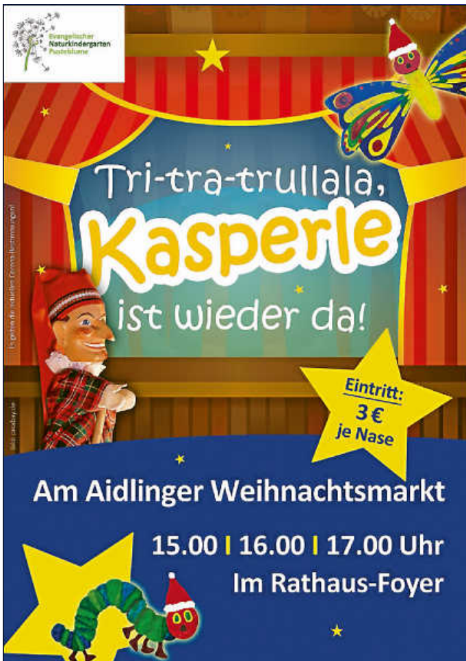
Plakat: Förderverein Naturkindergarten Pustoblume