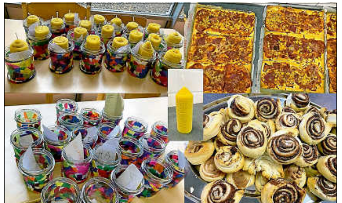
Impressionen der Herbstwoche

Als ehrenamtlich tätiger Verein sind wir auf Unterstützung angewiesen. Wer sich vorstellen kann, uns zu unterstützen (z.B. durch ein Programangebot von 2 Std. (unterstützt durch unser Betreuungsteam) kann sich gerne melden: info@feria-aidlingen.de . Wir finden für jede*n eine Tätigkeit, die Spaß macht und in unser Konzept passt (egal, wie viel Zeit investiert werden kann) - strahlende Kinderaugen werden es danken.