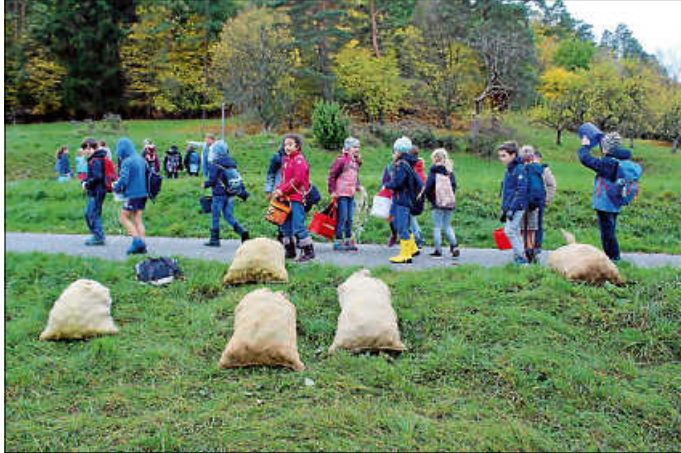
Viele gefüllte Apfelsäcke