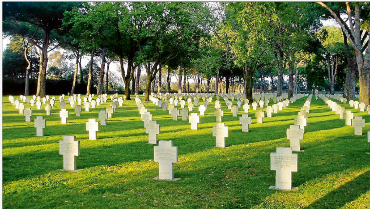
Kriegsgräberstätte Pomezia/Italien - hier ruhen drei Gefallene aus Aidlingen.