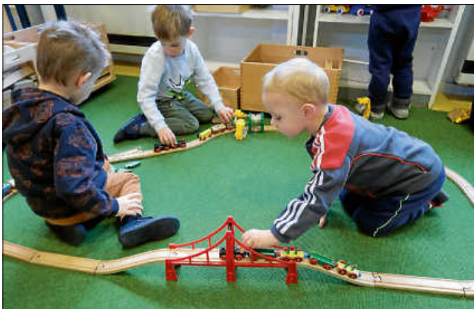
Die Kinder aus dem Kinderhaus Dachtel

Wir haben im Januar fünf neue Spielkameraden bekommen. Unsere neuen Freunde werden immer herzlich begrüßt und in unserem Kreis aufgenommen. Spielerisch kommen wir uns näher mit der schwäb'schen Eisenbahn, wo wir gemeinsam Gleise verlegen, Brücken bauen und Stellwerke anschließen. Hier werden wir schnell ein unschlagbares Team aus Zugführern, das selbst bei viel Verkehr auf der Schiene unfallfrei bleibt und pünktliches Ankommen garantiert.