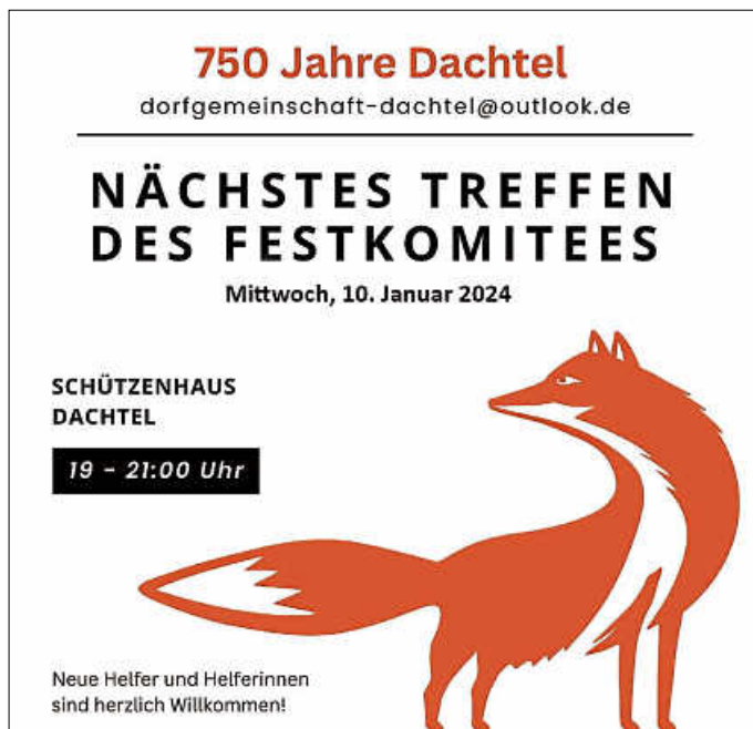
Grafik: Saskia Behnsen