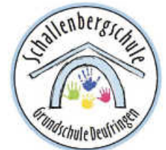
Logo: S. Weiß

Ein Freiwilliges Soziales Jahr (FSJ) ist ideal für alle, die sich beruflich und persönlich erst einmal orientieren wollen. Sammeln Sie Erfahrung, handeln Sie sozial und engagieren Sie sich für andere.