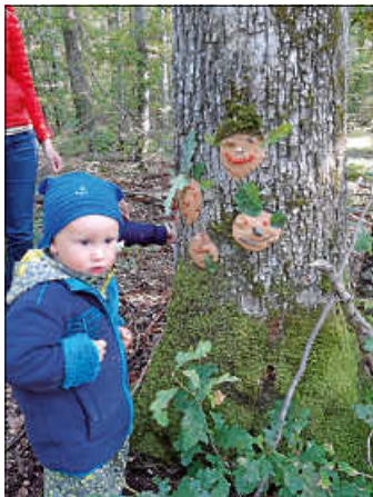
Werkeln mit Ton ...