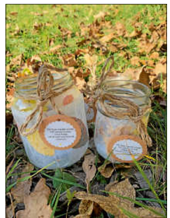
Fertig