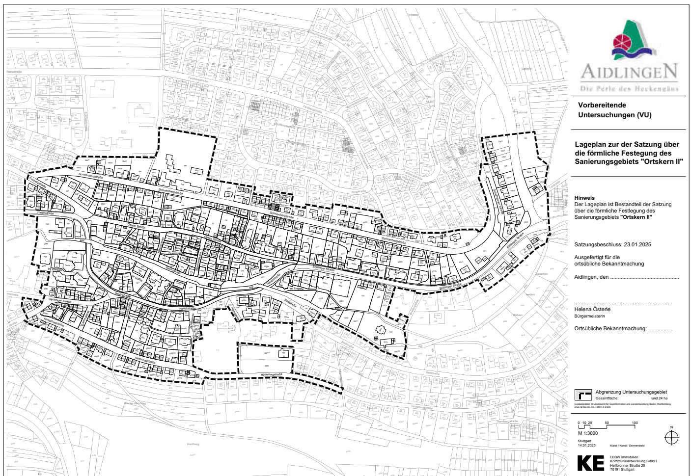
Lageplan zur Satzung über die förmliche Festlegung des Sanierungsgebietes