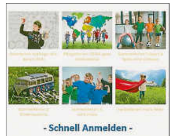
Grafik: Siegmund Zweigart

Es warten wieder spannende Projektwochen auf euch. Info und Anmeldung unter: www.feria-aidlingen.de