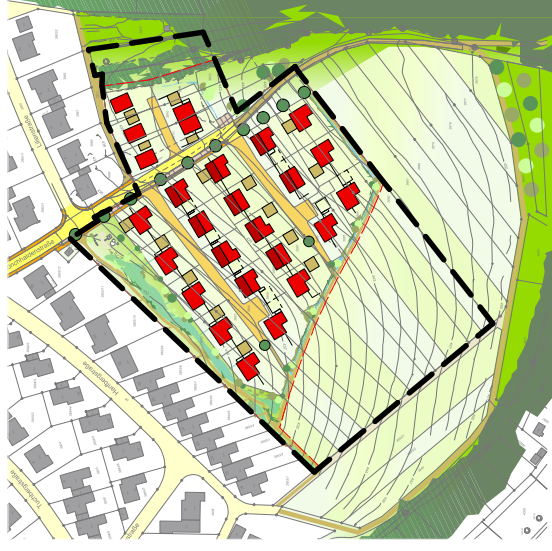
Lageplan Januar 2013 M. 1/2000