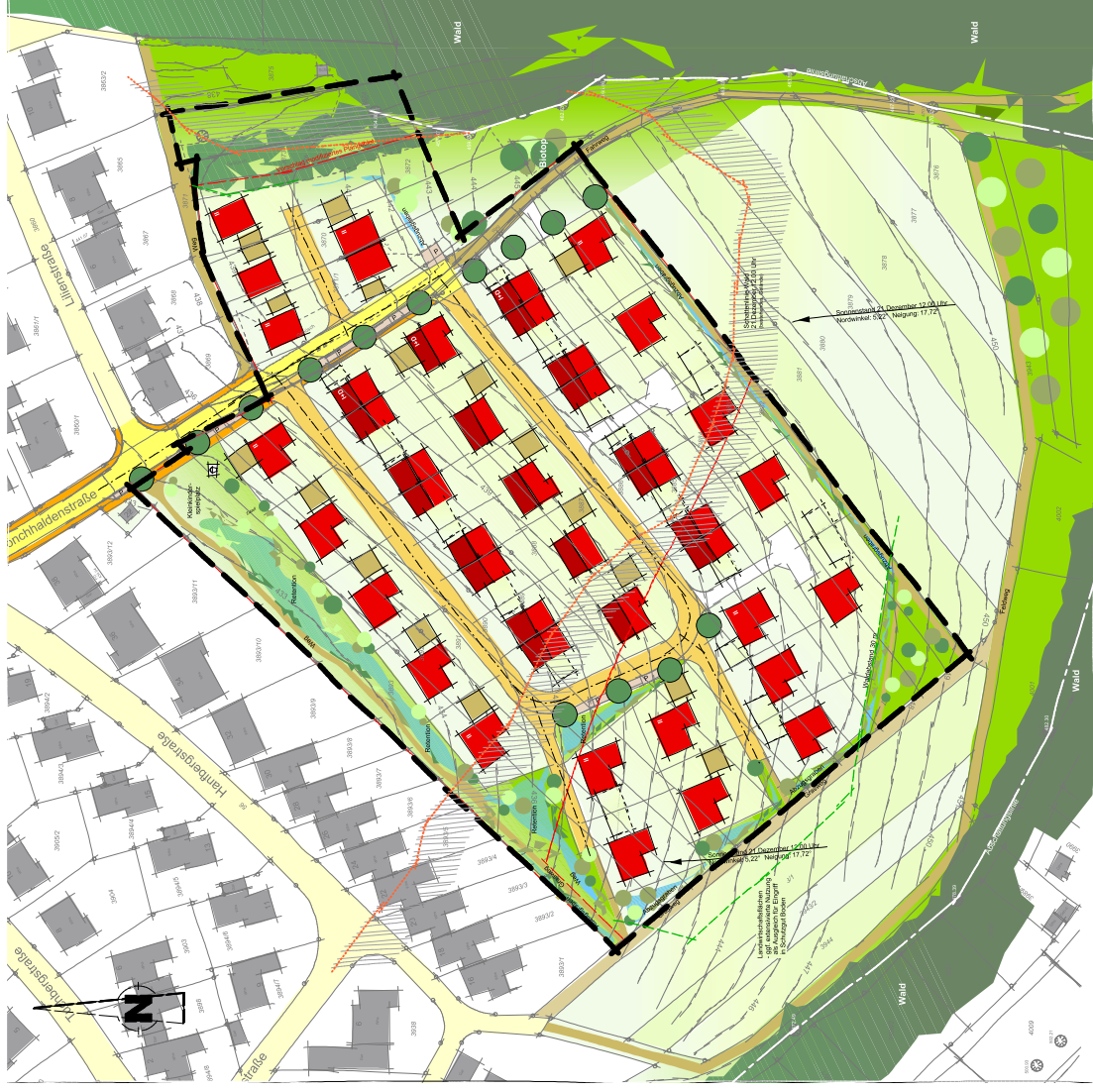
Lageplanskizze Maßstab 1/1000 März 2013 - mögliche Planfortschreibung