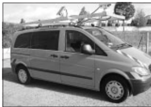
Kamerafahrzeug zur fotografischen Straßenraumdokumentation

Der Straßenzustand der Gemeinde Aidlingen soll dokumentiert werden. Hierzu ist es nötig, die Verkehrsflächen zu erfassen und zu bewerten.