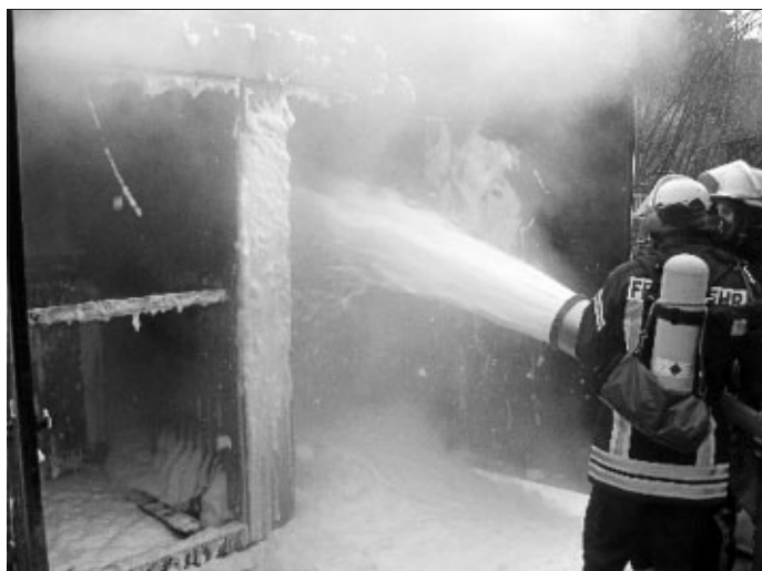
Nur mit Schaum konnte der Brand gelöscht werden

Da der Brandrauch stark unangenehm roch und noch in Aidlingen wahrgenommen wurde, alarmierte der Einsatzleiter zur Sicherheit für die Bevölkerung den Gerätewagen Messtechnik der Feuerwehr Sindelfingen. Es konnten keine gesundheitsgefährdenden Stoffe festgestellt werden. Der Einsatz selbst zog sich bis kurz vor 10 Uhr.