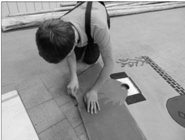
Bearbeiten der Spielstraße

An unserem letzten Dienstabend haben wir in den Projektgruppen gearbeitet.