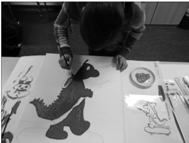
Malen des Maskottchens Grisu für den Jugendfeuerwehrraum

Am Montag, den 12.3. findet unser Dienstabend statt. Beginn ist wie immer um 18.30 Uhr im Gerätehaus.