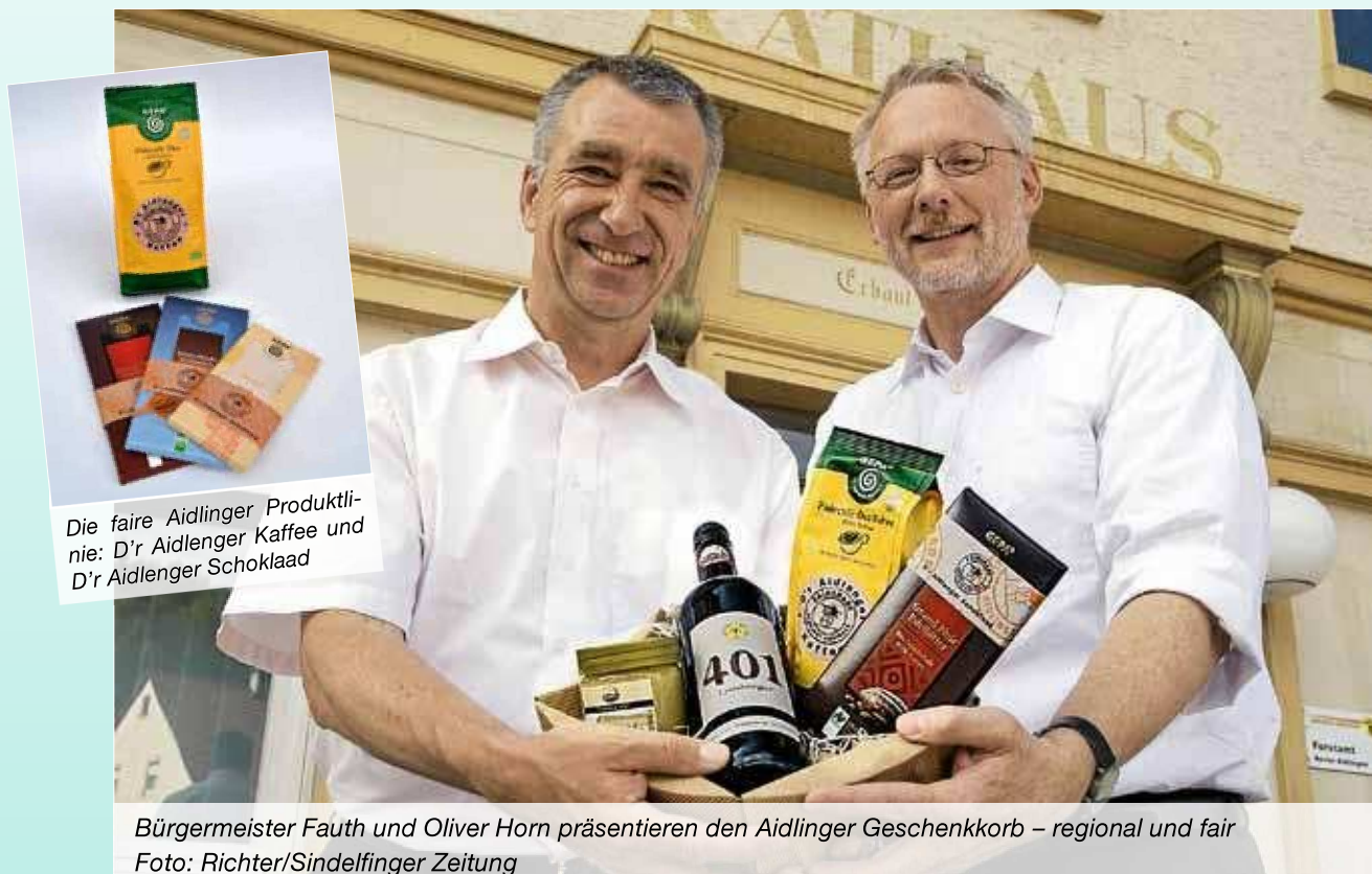
Die faire Aidlinger Produktlinie: D'r Aidlinger Kaffee und D'r Aidlinger Schoklaad