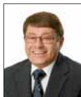
Günther Ott Freie Wähler