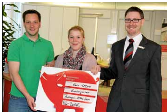
der Gesamtelternbeirat der Kindergärten Aidlingen